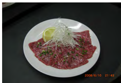
上ロース極楽塩焼