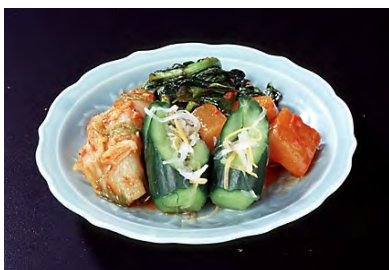
キムチ盛り合わせ