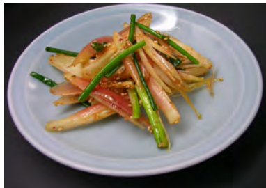
ミョウガとネギのキムチ