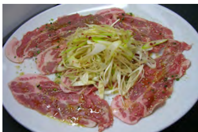
豚ロース大皿塩焼き