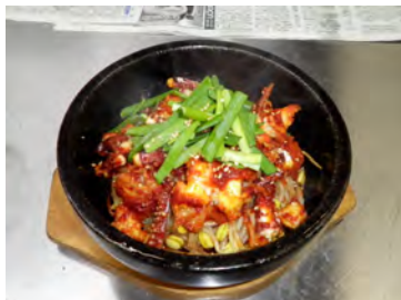
海鮮石焼ピビンパ