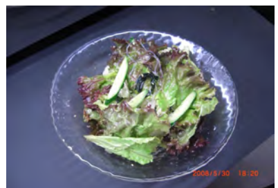
サニーレタスサラダ