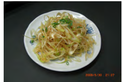
韓国風ネギムンチ