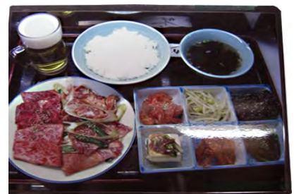
おつかれさま御膳