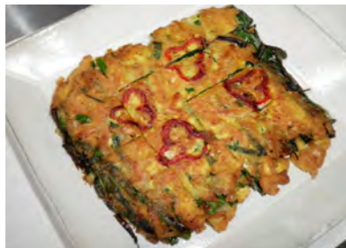
愛子ママ特製パジョン