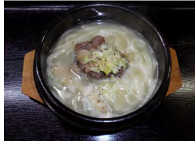
石鍋コムタンうどん