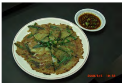
ネギとニラのチヂミ