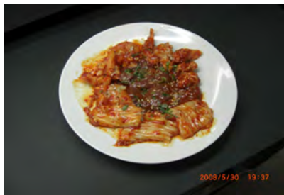
ホルモンセット[タレ]